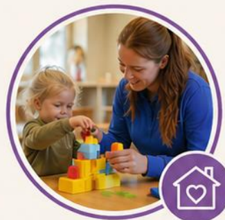
Peuterspeelzaal Samenspel – locatie De speeltuinvriendjes