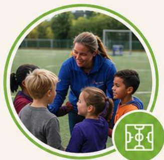
BSO Samenspel – locatie S.V. Nieuwkoop

Samen groeien, samen leren, samen spelen!