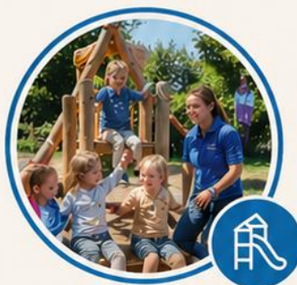
BSO Samenspel – locatie De blauwe speeltuin